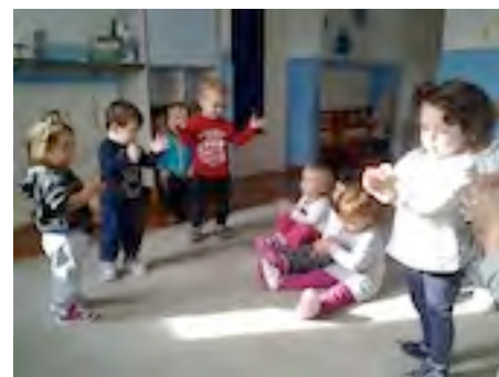
Autori Alessandra Caporali

Peter Pan è un nido comunale gestito, dalla sua apertura, dalla cooperativa sociale Koiné