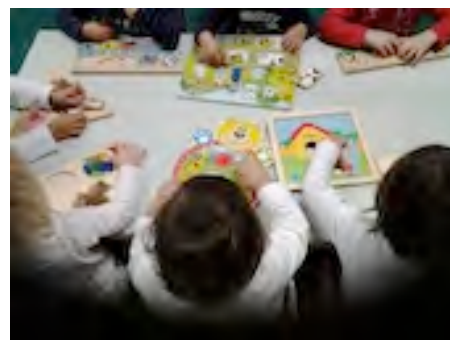
Nido La Carica dei Centopiuno

La Carica dei Centopiuno è un nido privato gestito da La Carica dei Centopiuno