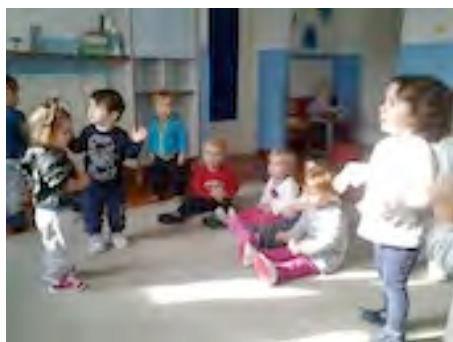
Comune Castiglion Fiorentino

Queste son le mie manine.... Presto via non ci son più... Queste son le farfalline ... Presto via non ci son più... Questo è un lungo cannocchiale... Presto via non c'è più... Questo è un nido da cullare... Presto via non c'è più... Questo è un morbido guanciale... Presto via non c'è più... Non è vero...non è vero... Farfalline, cannocchiale, nido e morbido guanciale... QUESTE SON LE MIE ... MANINE!