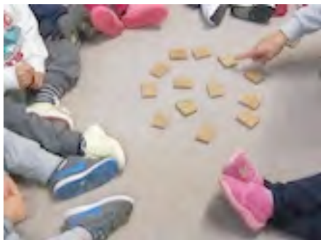
Nido Il Grillo Parlante La Pieve

Q uesto gioco permette di rispettare i tempi dell'attesa , aiuta a riconoscere il proprio contrassegno e quello degli altri, dà importanza a turno a ciascun bambino, insegna a memorizzare una bella “conta” e, cosa ancor più importante, i bambini imparano divertendosi!